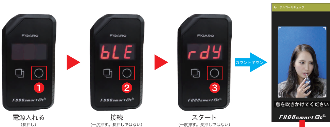
電源入れる (長押し)

① FUGOsmartBt 本体の○ボタンを” bLE” の文字が表示されるまで長押しして電源を入れてください。 ② もう一度○ボタンを押すと” rdy” と表示されます。③ アルコールチェックの準備が整ったら○ボタンをもう一度押してください。スマートフォン画面に 3・2・1 とカウントダウンが表示されますので、「GO」に切り替わったら、本体からピピッと音がするまで息を強く吹き続けてください。